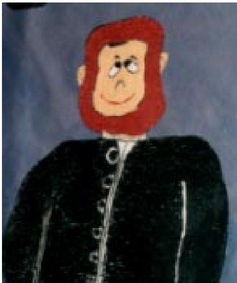
Sant Josep de Calassanç vist pels infants.

«Per l'albada s'endevina el dia que farà, i per un bon començament es pot preveure un bon final. El transcurs de la vida depèn de l'educació rebuda en la infància: mai no perd la seva bona aroma, igual com passa amb un recipient que ha guardat un bon licor.»